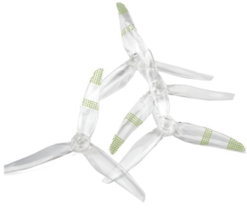
프로펠러 x 4