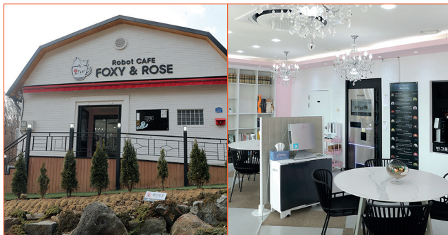
· 경기도 광주 로봇카페