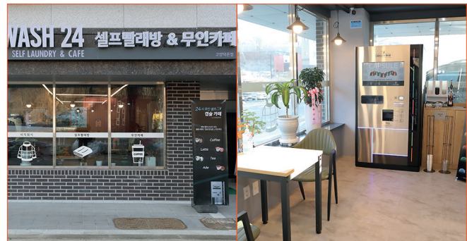
· 고양시 빨래방