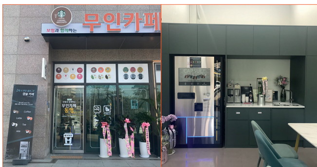
· 안성 보험카페