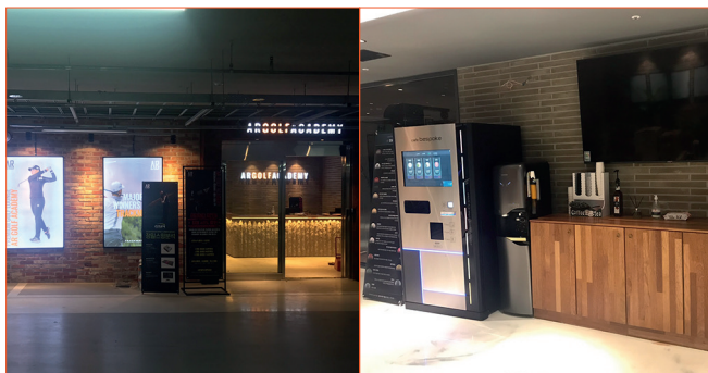
· 광고 골프연습장