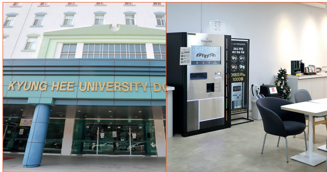
· 경희대 기숙사