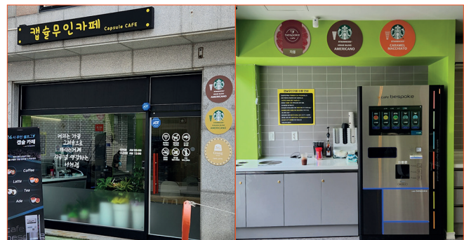
· 남해 무인카페