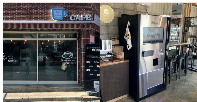
· 구미 무인카페